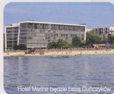
Hotel Marine będzie bazą Duńczyków

ogłoszeniu wyników losowania pierwsi zdecydowali się na hotel Monopol we Wrocławiu, a drużyna na Warszawiankę w Jachrance, choć rozważali też Holiday Inn w Józefowie. Rosjanie byli jedyną drużyną, która jeszcze przed losowaniem była zdecydowana wybrać Ukrainę, ale gdy okazało się, że trafiła do „polskiej” grupy wynajęła jeden z najbardziej ekskluzywnych hoteli w Polsce, położony przy Krakowskim Przedmieściu w Warszawie