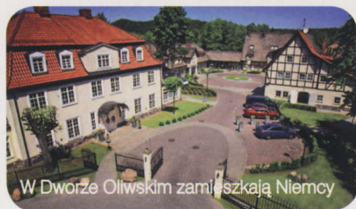
W Dworze Oliwskim zamieszkała Niemcy

Losowanie grup, które odbyło się 2 grudnia w Kijowie, było bardzo korzystne dla reprezentacji Polski, gdyż trafiła na najsłabszych z możliwych rywali: Greków, Rosjan i Czechów. Ale dla polskiej branży turystycznej było jednym z gorszych, jakie mogła sobie wyobrazić. Drużyny, za którymi jeździ najwięcej kibiców m.in. Anglia, Niemcy, Francja, Holandia, czy Dania i Szwecja, których kibice liczyli, że przepłyną tylko promem Bałtyk i pójdą na stadion, grały będą na Ukrainie. W Polsce zagrają reprezentacje małych krajów pogrążonych w kryzysie jak Grecja czy Irlandia, również niewielka Chorwacja czy Czecha, których