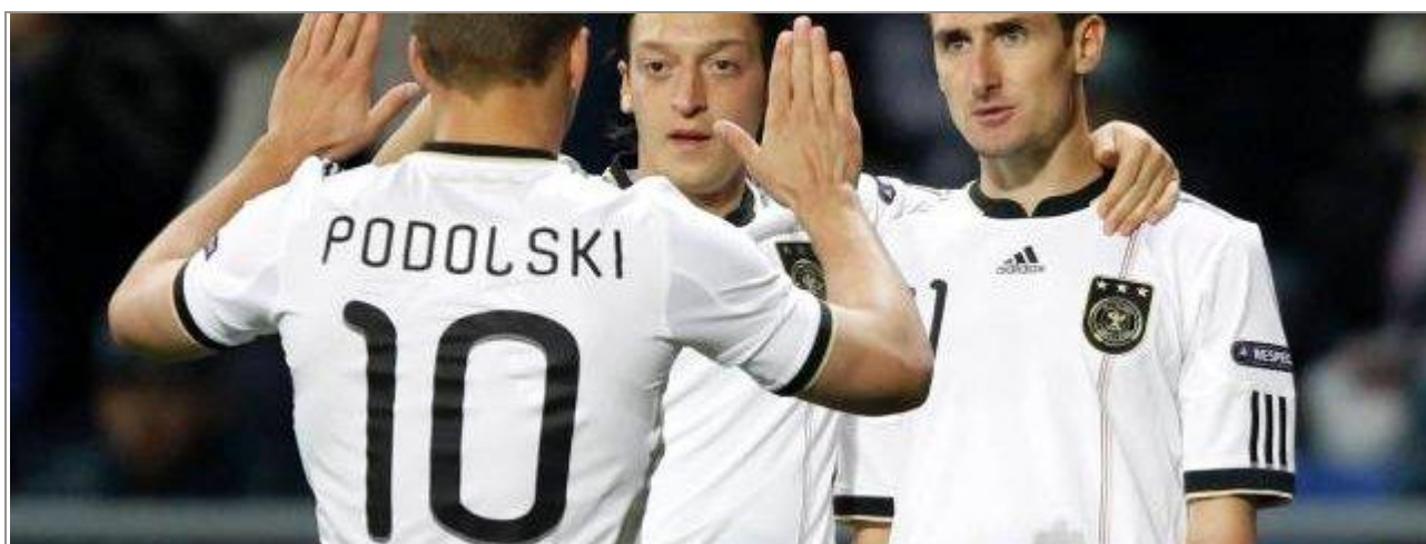
Niemcy cieszą się po strzelonej bramce

2011-05-18, ostatnia aktualizacja 2011-05-19 13:28